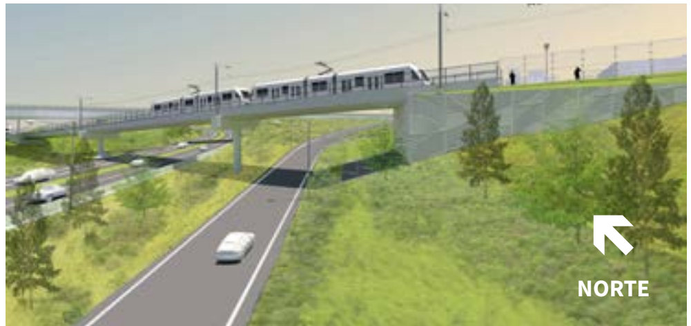
La representación conceptual está sujeta a cambios

La segunda vía se construirá junto a la vía existente, además de un nuevo camino multiusos entre la estación de MAX y NE 82nd Way.