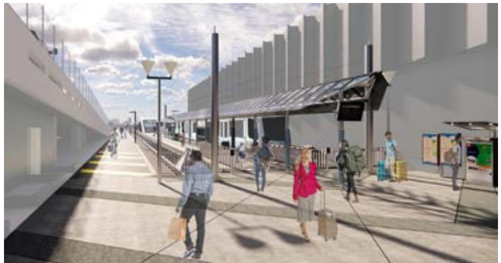
La representación conceptual está sujeta a cambios