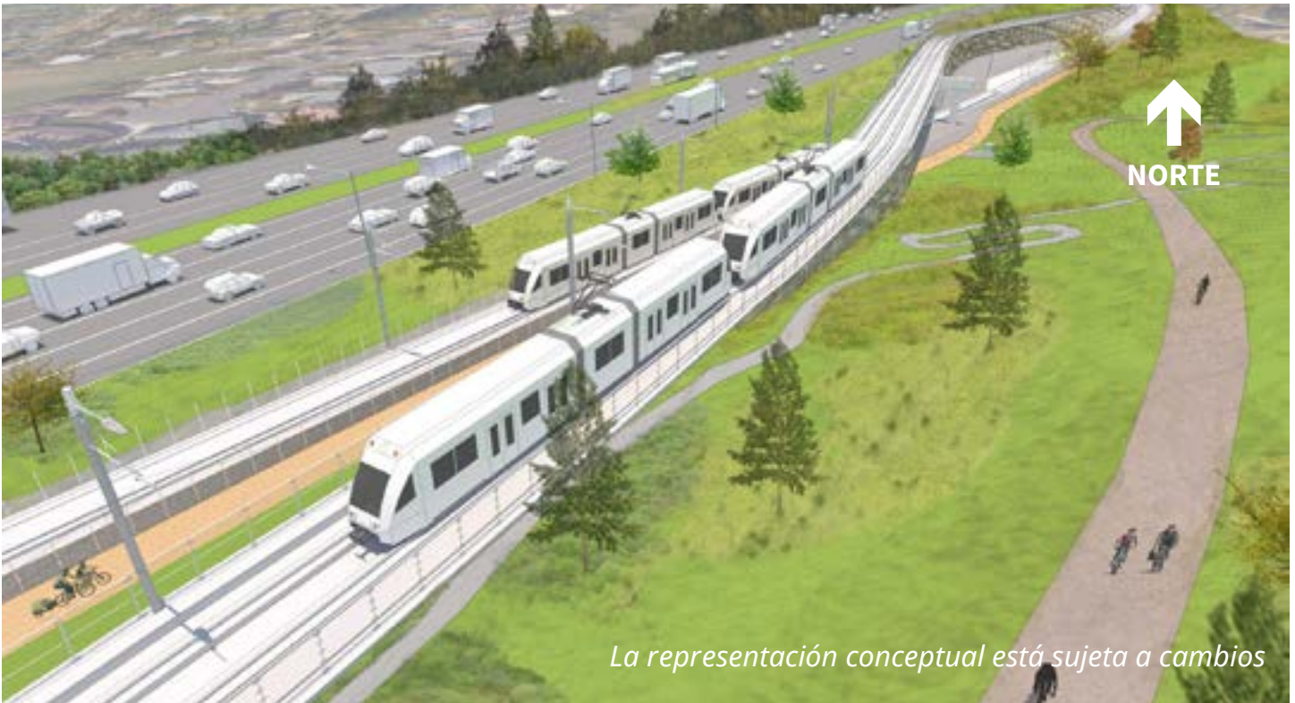
La representación conceptual está sujeta a cambios

Se construirán dos puentes nuevos para incorporar la segunda vía: